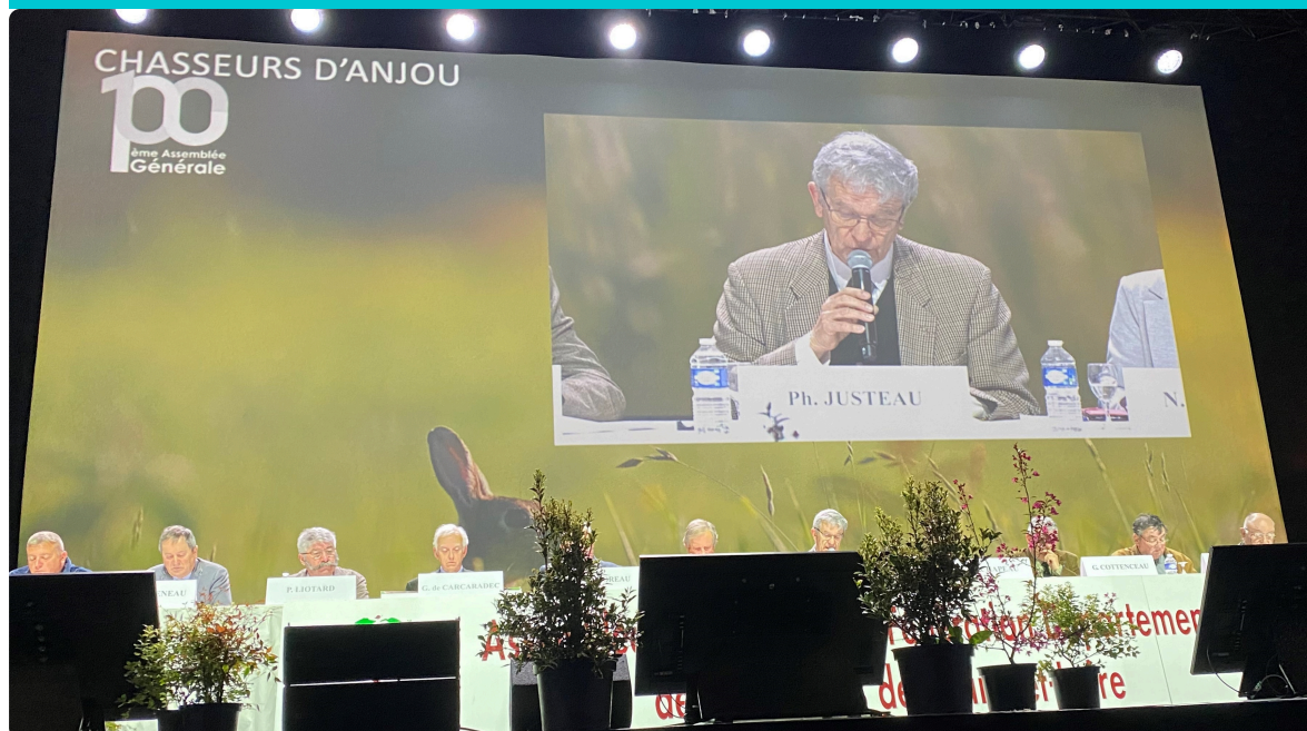
100ème assemblée générale des Chasseurs d'Anjou le samedi 6 avril 2024